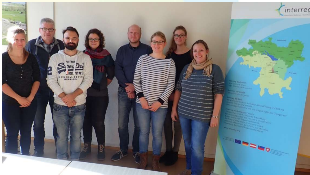
Abb.3: Projekttreffen der Projektpartner in Güttingen (CH) im Herbst 2017

Die Obstproduktion steht vor großen Herausforderungen für die Zukunft . Detailhandel und Konsumenten fordern qualitativ hochwertige, gesunde, rückstandsfreie und preiswerte Lebensmittel, deren Produktion nachhaltig und umweltschonend sein soll. Gleichzeitig gibt es europaweit laufend Änderungen der Rahmenbedingungen wie Ressourcenverknappung, Wetterextreme und reduzierte Verfügbarkeit von Pflanzenschutzmitteln. Bereits heute absehbare Änderungen für den Pflanzenschutz sind der mittelfristige Wegfall ganzer Wirkstoffgruppen, gravierende Einschränkungen in den Anwendungsbestimmungen, erhöhte Rückstands- und Abstandsauflagen und reduzierte Aufwandmengen. Um weiterhin mit diesen Rahmenbedingungen Obst im Bodenseeraum produzieren zu können, müssen innovative systembasierte Lösungen entwickelt werden. Ziel des Projektes ist das Aufzeigen neuer Wege, wie die Produktion qualitativ hochstehender, gesunder und weitgehend rückstandsfreier Früchte bei messbar reduziertem Pflanzenschutzmitteleinsatz realisiert werden könnte. Die Obstbranche im Wirtschaftsraum Bodensee soll hierbei grenzüberschreitend eine Vorreiterrolle übernehmen.