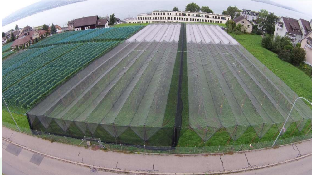
Abb.1: Apfel-Modellanlage von Agroscope am Standort Wädenswil mit Hagelschutznetz, seitlichem Insektenschutznetz und Folienabdeckung

Projektzeitraum: 01.01.2015 bis 31.12.2020